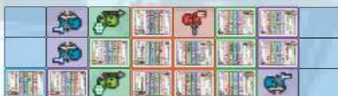
Резерв Тыл Фланг Авангард Фланг Тыл Резерв

Рисунок ниже изображает два противостоящих отряда.